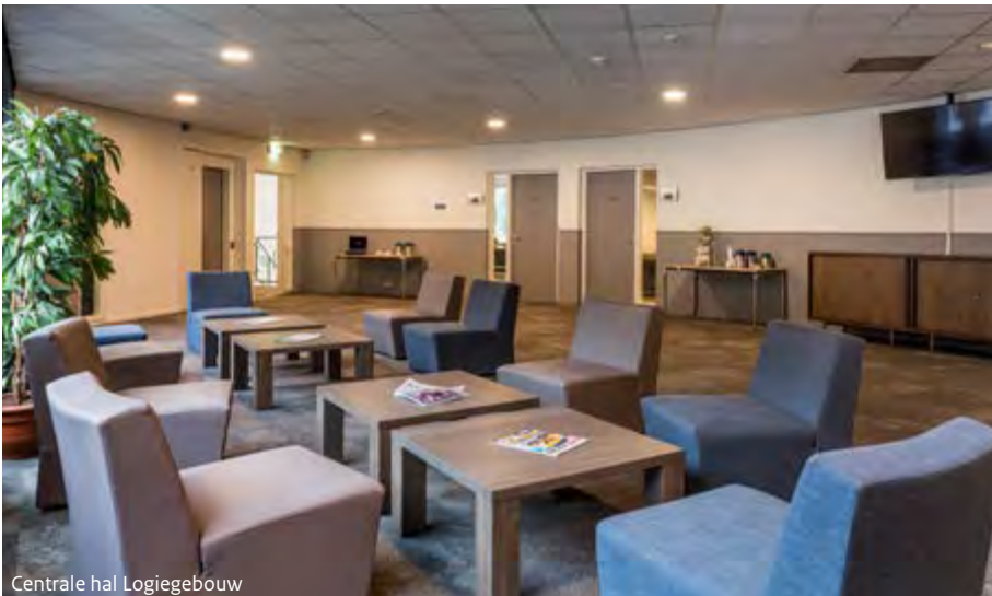
Centrale hal Logiegebouw